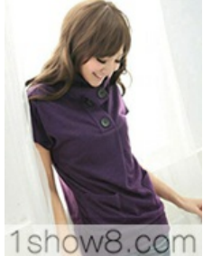
1show8.com Q-1700 Ñs'rÄËY`Td :÷178... 178 C 6ĭ | -p